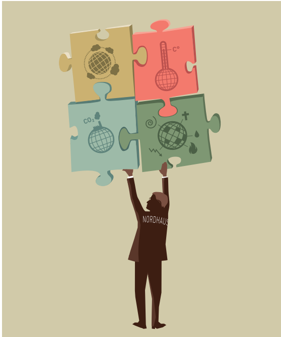
Nordhaus forskning visar hur ekonomi i växelverkan med kemi och fysik skapar klimatförändringar.