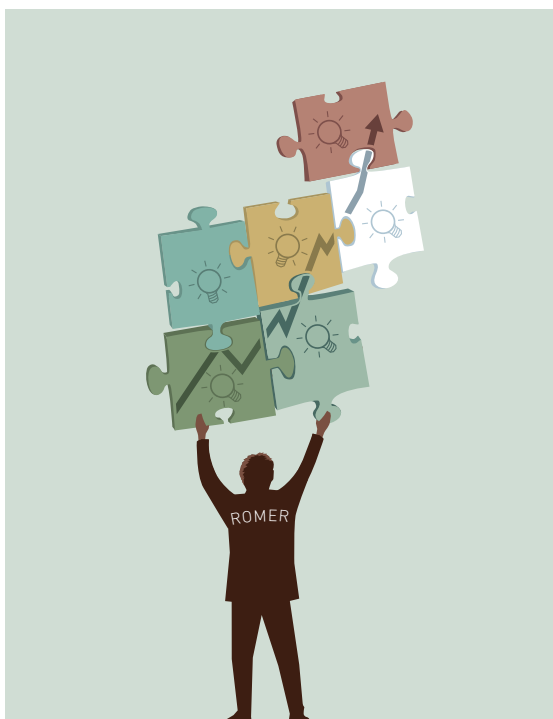
Romers forskning visar hur ackumulering av idéer skapar uthållig tillväxt.

Globala marknadsmisslyckanden Årets pristagare lägger stor vikt vid hur beslut som fattas av enskilda innovatörer eller företag spiller över på hela samhället. Varhelst en ny idé eller uppfinning har sina rötter kan man använda den över hela världen för att skapa nya produkter och idéer – nu och i framtiden. På samma sätt sprider sig en enhet koldioxid, oavsett ursprung, snabbt i atmosfären och påverkar oss alla genom att bidra till global uppvärmning – nu och i framtiden. Ekonomer kallar sådana spridningseffekter för externa effekter . De externa effekter som Romer och Nordhaus analyserar har globala långsiktiga konsekvenser och utan reglering kommer de att leda till att marknaden inte fungerar väl. Romers och Nordhaus forskning talar alltså tydligt för att det krävs marknadsreglering för att komma tillrätta med sådana positiva eller negativa externa effekter.