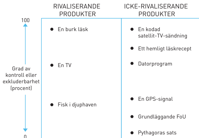
Figur 2: Rivaliserande och exkluderbara produkter.

Romer menade att en teori för marknadsproduktion av idéer måste ta hänsyn till att kostnaderna för varor som bygger på nya idéer ofta sjunker snabbt. Den första prototypen är dyr att ta fram, men marginalkostnaden för att sedan reproducera den är låg. En sådan kostnadsstruktur gör att företag måste sätta tillräckligt höga marginaler på nya produkter för att kunna ta igen startkostnaden. För att ha incitament att ta fram nya produkter måste ett företag därför ha en viss monopolställning, något som bara är möjligt för exkluderbara idéer. Romer visade också att, till skillnad från tillväxt som bygger på ackumulering av fysiskt kapital så behöver inte tillväxt som bygger på ackumulering av idéer avstanna. Med andra ord så visade Romer att uthållig tillväxt måste vara idédriven.