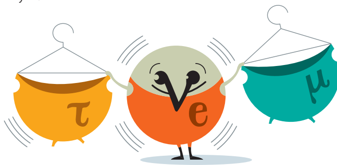
Neutrion i valet och kvalet mellan olika identiteter – tau-, elektron- eller myonneutrino?

Jakten har pågått djupt under jorden i gigantiska anläggningar där tusentals konstgjorda ögon väntat på rätt ögonblick för att röja neutrinernas hemligheter. År 1998 presenterade Takaaki Kajita upptäckten att neutriner verkar genomgå en metamorfos. De växlar mellan olika neutrinoidentiteter på väg till detektorn Super-Kamiokande i Japan. Neutriner som fångats där skapas i reaktioner mellan kosmisk strålning och jordens atmosfär.