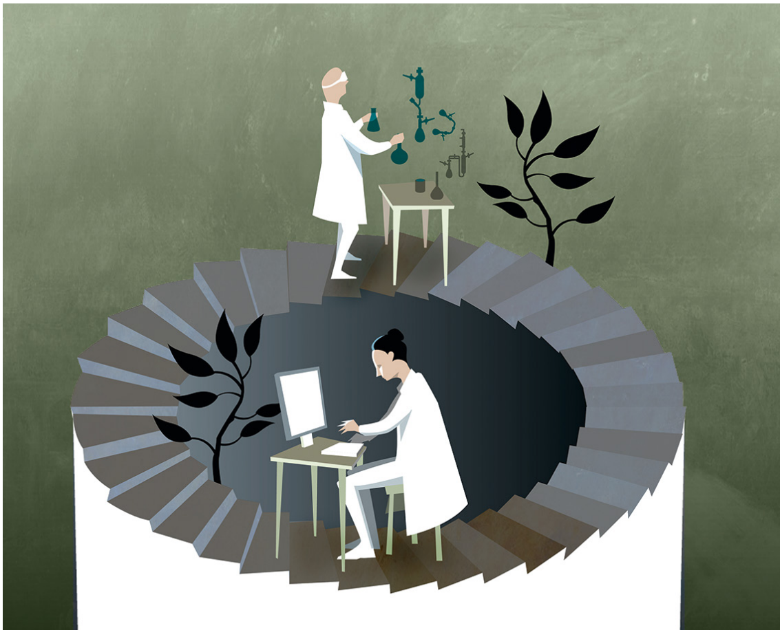
Bild 1. Idag experimenterar kemister lika mycket i sina datorer som i laboratoriet. Datorernas teoretiska resultat bekräftas genom verkliga experiment som kan ge nya ledtrådar till hur atomvärlden fungerar. Teori och praktik korsbefruktar på så vis varandra.

För att du som läsare ska få en uppfattning om vilken nytta mänskligheten kan ha av detta, ska vi börja med ett exempel. Du ska få ta på dig en labbrock och anta en utmaning: att skapa konstgjord fotosyntes. Den kemiska reaktion som sker i blommors gröna blad, fyller atmosfären med syre och är en grund för liv på jorden. Men den är också intressant ur ett miljötekniskt perspektiv. Kan du härma den, skulle du kunna effektivisera solceller. När vattenmolekyler spjälkas bildas, förutom syre, även väte som skulle kunna driva våra bilar. Det finns alltså anledning för dig att engagera dig i detta projekt. Lyckas du, kan du bidra till att lösa problemen med växthuseffekten.