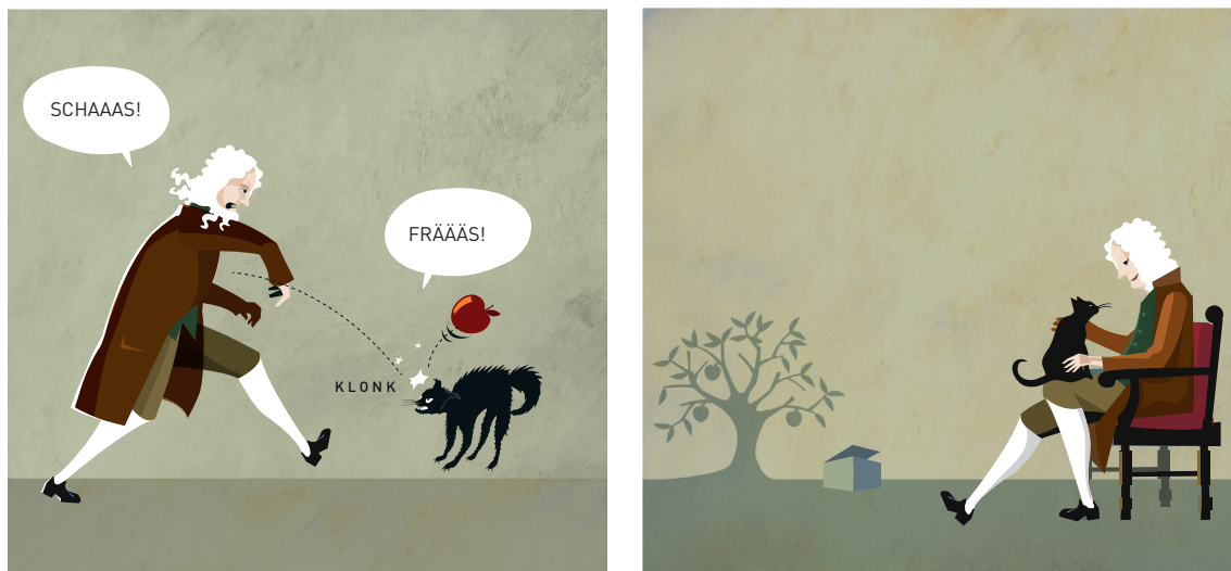
Bild 2. Newton och Schrödingers katt. Tidigare var den klassiska fysiken och kvantkemin två rivaliserande världar. 2013 års Nobelpristagare i kemi har öppnat en dörr mellan dem och fått till ett fruktbart samarbete.

Det första steget mot detta samarbete togs i början av 1970-talet på Martin Karplus laboratorium vid Harvarduniversitetet i Cambridge, USA. Martin Karplus var djupt rotad i kvantvärlden. Hans forskargrupp tog fram datorprogram som med hjälp av kvantfysik simulerade kemiska reaktioner. Under sin karriär hade han också utvecklat den så kallade Karplusekvationen som används inom kärnmagnetisk resonans (NMR); en metod som är välkänd bland kemister och som bygger på molekylers kvantkemiska egenskaper.